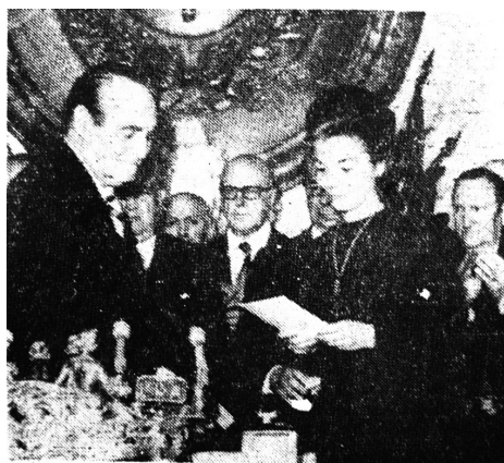
Jura para desempeñarse en Cultura y Educación el doctor Oscar Ivanissevich.

Fuente: Diario Los Andes , 15 de agosto de 1974