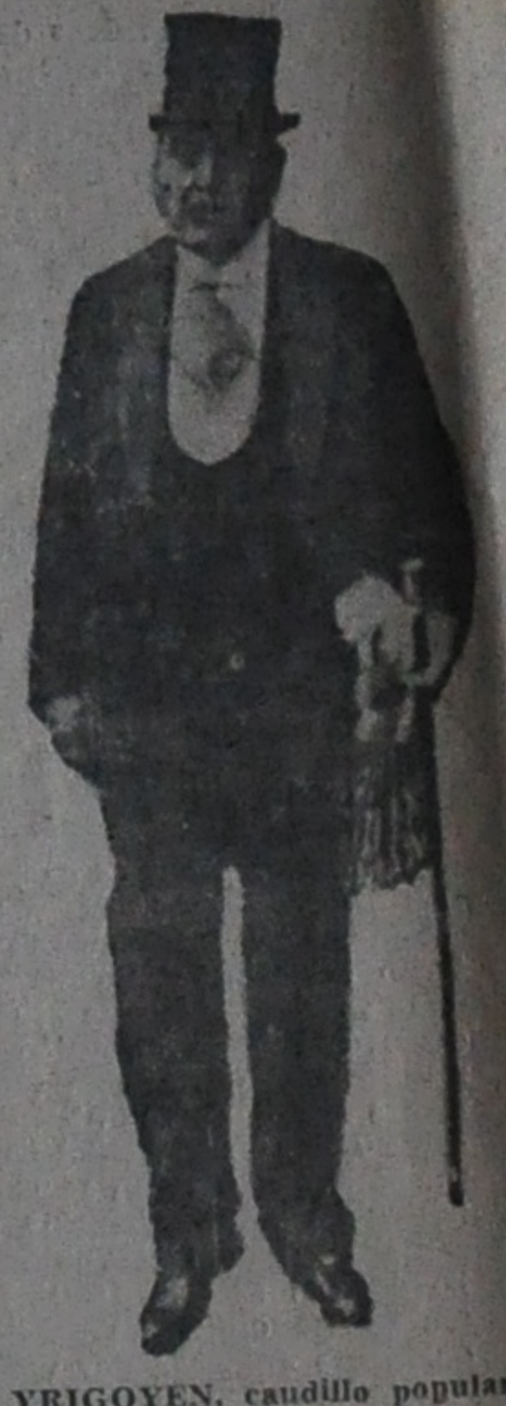
IRIGOYEN, caudillo popular.