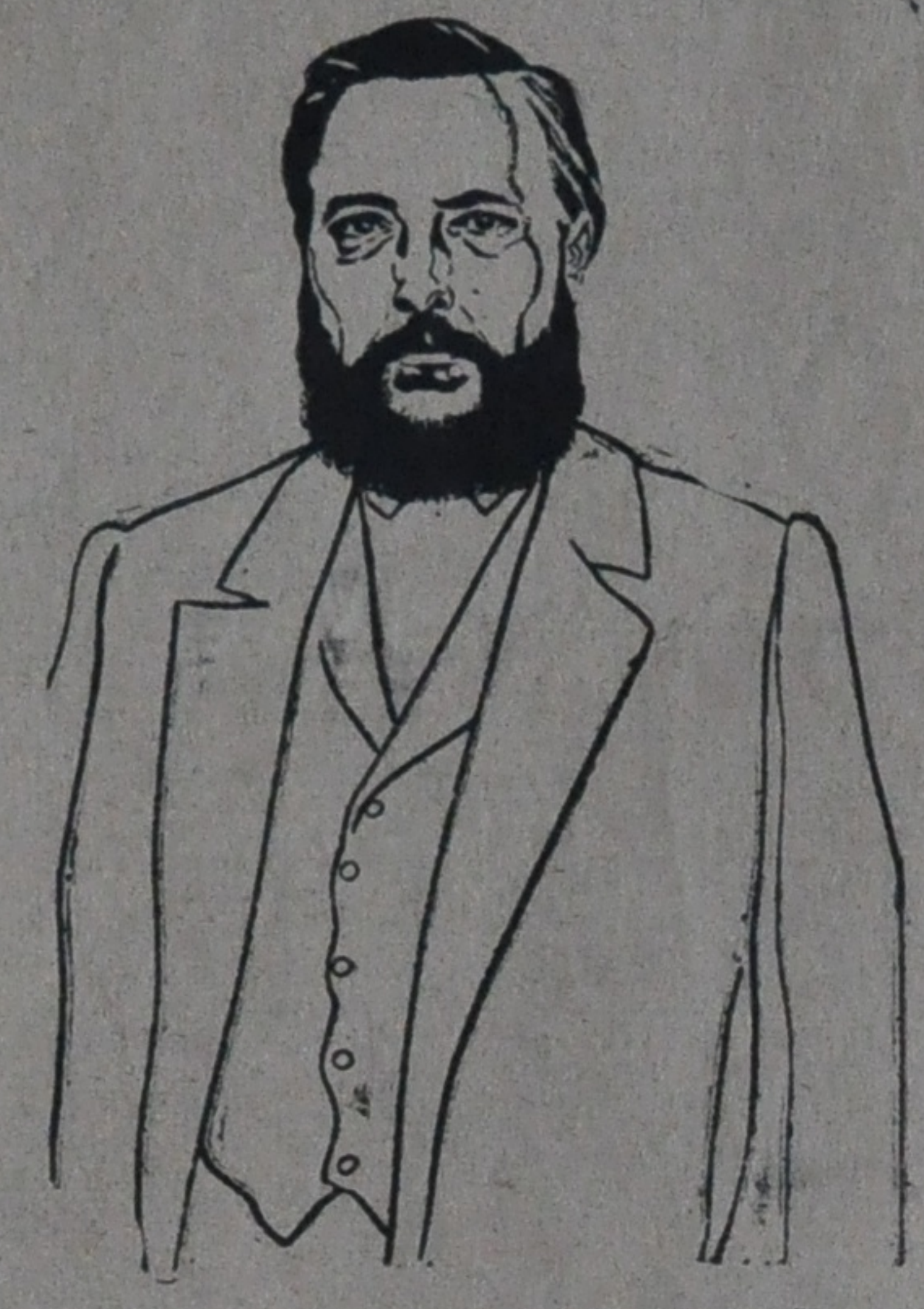
JOSÉ HERNÁNDEZ, autor de "Martín Fierro" y gran político.

beruador bonaerense que resistió la entrega de Buenos Aires para capital de país: "A los ocho días de haberse firmado la revolución, yo estaba en una manifestación en la calle Florida y vi al doctor Tejedor, jefe de esa revolución sangrienta, tranquilamente en sus balcones, presenciando el desfile... Es, pura, de esa época que data la verdadera evolución civilizadora del pueblo argentino... Y, sin embargo, hace 15 años, los emigrados formábamos ejércitos". Y aludiendo directamente a esa época (la presidencia de Mitre), termina: "A los seis años del estado de sitio que sufrió la República; a la guerra fúnebre del Paraguay; a las intervenciones armadas que se llevaron a las provincias, con batallones enganchados capitaneados por los extranjeros más