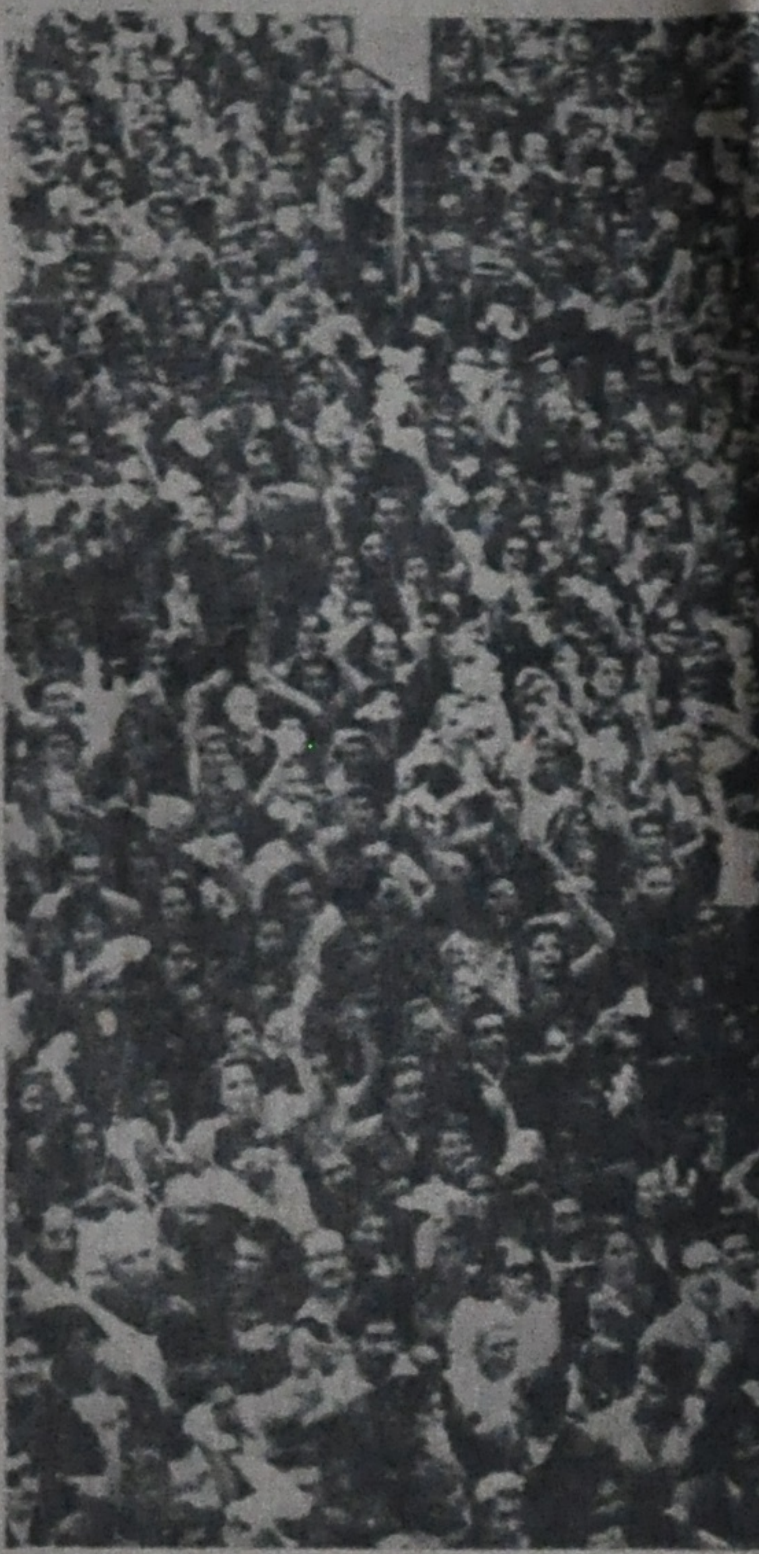
Las masas trabajadoras imprimieron el 17 de Octubre su sello a la revolución democrática argentina. Ellas son la única garantía de su consolidación.

Al producirse la última guerra (1930-1945), la industria argentina experimentó un gran desarrollo y la demanda de fuerza de trabajo creció en proporción, llegando casi al millón el número de obreros industriales. El movimiento obrero encontró así condiciones económicas más favorables que nunca anteriormente para su desenvolvimiento y auto-defensa; la desocupación, la permanente falta de trabajo que tantas veces frustraron los intentos del proletariado industrial por organizarse y resistir a la patronal habían desaparecido. Cualquier paralización del trabajo debido a huelgas afectaba además, no sólo a los industriales, sino al conjunto de la burguesía, que interrumpidas las relaciones normales con la metrópolis, dependía ahora en