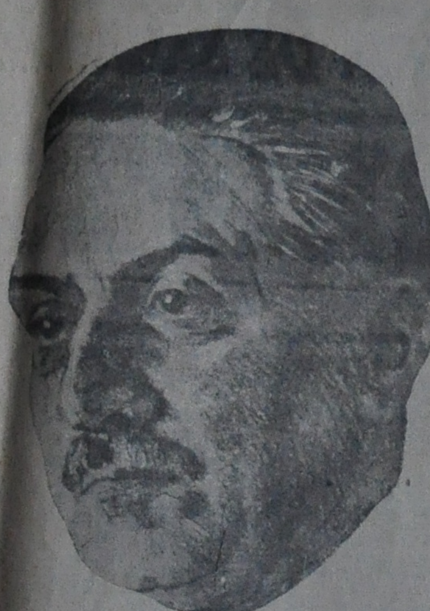
Manuel Ugarte, precursor de la unidad Latinoamericana.