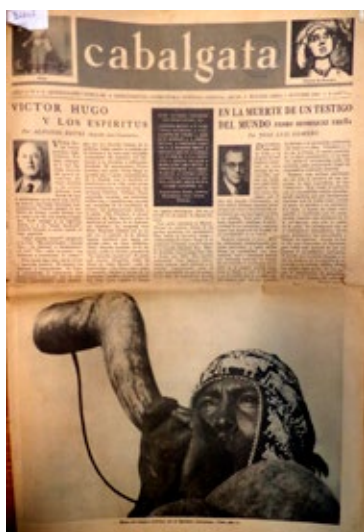
Figura 1. Portada del número 1 de Cabalgata (1 de octubre de 1946)

cada mes, cambio que se refleja, a su vez, en el nuevo subtítulo: “Revista mensual de letras y artes”.