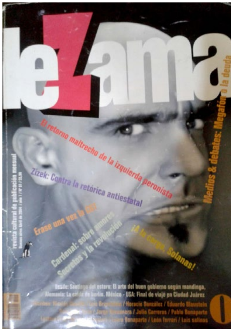
Figura 1: “Crispación”. Portada del primer número de Lezama , nº 1, abril de 2004

La portada del número 1 de Lezama es, a simple vista, toda una interpelación (figura 1):