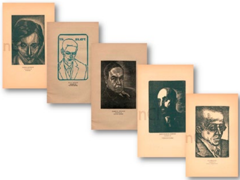
Grabados de Pierre Reverdy, T.S. Eliot, Rubén Darío, Juan Ramón Jiménez y Klabund en Poesía .

En la selección de los autores retratados encontramos la intención de priorizar a los extranjeros por sobre los colaboradores argentinos que pocos años antes habían conformado la “nueva sensibilidad”. Se publicaron grabados de los poetas Pierre Reverdy, T.S. Eliot, Rubén Darío, Juan Ramón Jiménez y Klabund. Este aspecto, entre otros, deja ver que el trabajo de conservación no se limitaba al campo literario nacional sino que expandía sus límites y priorizaba la presentación de los escritores foráneos, algunos de ellos bien conocidos por el lector argentino, como sucedía con Rubén Darío. Las ilustraciones más importantes de la revista, por ser las de mayor tamaño, no se vincularon semánticamente con el texto que acompañaban sino que tenían como función presentar visualmente a un poeta. En este caso, como en todos aquellos