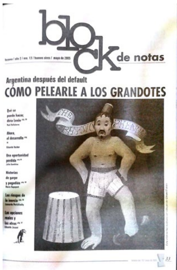
Figura 2: Portada del dossier atinente a la deuda externa y el default, Lezama nro. 13, mayo de 2005

circulación como en la propia vida política. En los 17 números de la revista, hay al menos diecinueve textos que encaran directamente la crítica de ese lugar común o la bordean haciendo de la deuda externa un punto sobre el que pivotean las cuestiones postergadas. Así por ejemplo, el número 13 proponía en el Block de notas (figura 2) cuestiones que hacían a la relación “deuda y política”.