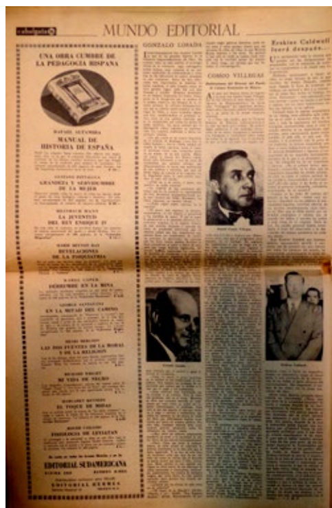
Figura 8. Sección “Mundo editorial” ( Cabalgata , 1, 1 de octubre de 1946, p. 16)

La sección resulta importante en la medida en que permite observar las preocupaciones recurrentes de los editores en torno al año 1947, considerado un punto de referencia en la historia de la edición argentina (Rivera, 1998, PP. 120-121): por un lado, la industria atraviesa uno de sus mejores momentos, tanto por la calidad de las editoriales en lo que respecta a materiales y catálogos, como por la cantidad de ejemplares editados; pero, por otro lado, se presentan problemas que se irán acrecentando en los años posteriores, tales como la falta de divisas en los países latinoamericanos para el pago de los libros importados desde la Argentina, los problemas del transporte y distribución de los libros, y el aumento