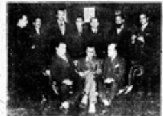
UNA REUNIÓN DE LA VIDA LITERARIA

Este libro es una obra de gran importancia, ya que es el primer libro que trata de la historia editorial argentina. El autor analiza la situación del mundo editorial argentino en ese momento, y ofrece una visión crítica y objetiva de la situación. Este libro es una obra de gran valor para los estudiosos de la historia editorial argentina.