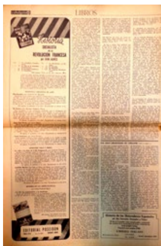
Figuras 5 y 6. Sección “Libros” ( Cabalgata , 1, 1 de octubre de 1946, pp. 17-18)