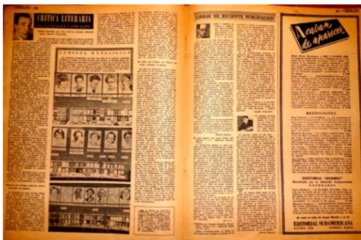
Figura 7. “Crítica literaria” y “Libros de reciente publicación” ( Cabalgata , 11, 11 de marzo de 1947, pp. 22-23)