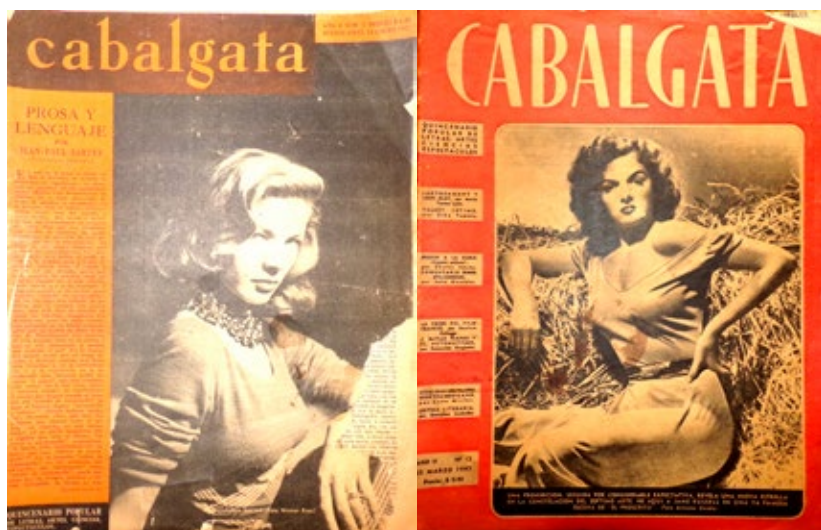
Figuras 2 y 3. Portada del número 7 de Cabalgata (14 de enero de 1947) y portada del número 12 de Cabalgata (25 de marzo de 1947)