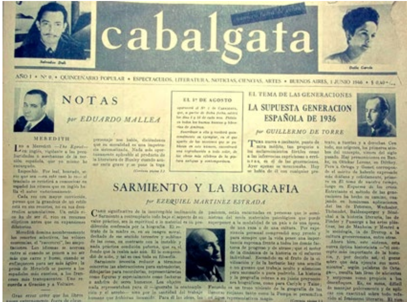
Figura 4. Detalle de portada del número 0 de Cabalgata (1 de junio de 1946)