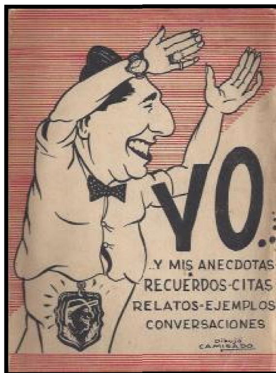
Anónimo. Rosario. 1956.