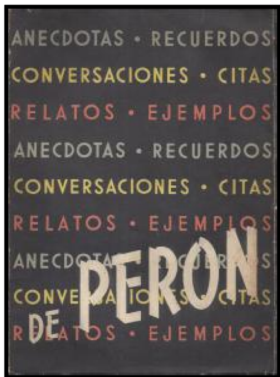
Subsecretaría de Informaciones. Bs.As.1952