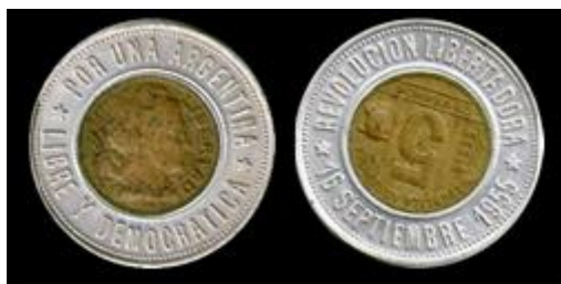
3 - Colección Giménez Puig (Buenos Aires) Fecha de la moneda del centro: 1949