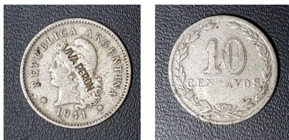
Fig. 14: 10 centavos 1941. Cuproníquel Contramarca «VIVA PERON» en anverso CJ: #128