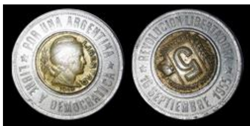
7 - Colección Chervero (Tandil) Fecha de la moneda del centro: 1948. La pieza presenta un giro de XXX