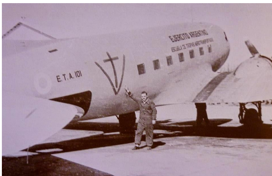
Fig. 9: «Cristo Vence», sobre uno de los aviones que participaron en el bombardeo sobre Plaza de Mayo en 1955. Estas acciones, dejaron cientos de civiles muertos.

Es curioso notar el ingenio popular a la hora de transformar y resignificar la simbología de sus enemigos políticos. El «PV» (véase la Fig. 8), es una evolución del mismísimo «Cristo Vence» (conformado por una cruz sobre una enorme letra «V»), de tradición católica, que era uno de los eslóganes esgrimidos por los sectores antiperonistas, en razón a las insalvables disputas que surgieron entre Perón y la Iglesia Católica. El símbolo de «Cristo Vence» (Fig. 9), se vio, por ejemplo, pintado en los fuselajes de los aviones de la Aviación Naval que bombardearon Plaza de Mayo en junio de 1955 con el objetivo de derrocar al gobierno peronista ( vide supra ) 45 . La evolución de la simbología, incluso fue más allá, y las modificaciones hechas por unos a las pintadas, obtenían nuevas modificaciones y resignificaciones de las mismas por parte de los contrarios. A continuación, se resumen estos cambios: