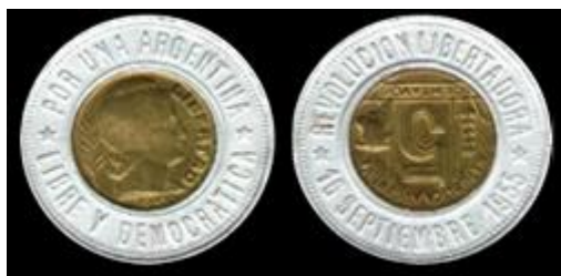
2 - Colección Pesciarelli (Mar del Plata) Fecha de la moneda del centro: 1949