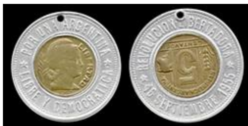
Fig. 4: Primer ejemplar conocido de las fichas bimetálicas as de la «Revolución Libertadora». en aquel momento, parte de la Colección De Ansó.

La moneda de 5 centavos que se utilizó para componer el centro presenta una alineación de cuños orientada a las 6:00 h 22 ; las leyendas del aro exterior, por el contrario, presentan un eje que se alinea a las 12 h, 23 por lo que no se puede hablar de una alineación de cuños general que se aplique a la pieza en su totalidad.