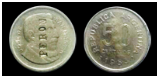
Fig. 12: 50 centavos 1953. Acero enchapado Contramarca «PERON» en anverso CJ: #224

A continuación, se muestran, sólo a modo ilustrativo, distintas versiones de contramarcas peronistas que pueden encontrarse en las monedas argentinas circulantes entre 1955 y 1973, es decir, el periodo que históricamente corresponde a la denominada «resistencia peronista». 50