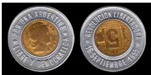
6 - Colección Panozzo (Bellavista) Fecha de la moneda del centro: 1948