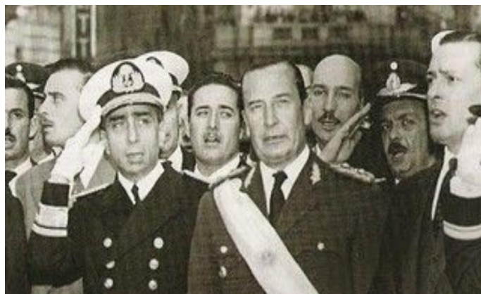
Fig. 7: El General Pedro Eugenio Aramburu, uno de los líderes del golpe cívico-militar de 1955 (investido como presidente de facto en 1955, tras suceder a Eduardo Lonardi). A su derecha, otro cabecilla del alzamiento, el contraalmirante Isaac Rojas (comandante de la Marina de Guerra en operaciones).

Fuera de la resistencia peronista que se venía realizando, inorgánica y descentralizada, surgieron algunos grupos armados. El único de ellos que se puede identificar plenamente con el peronismo es el de los Usturuncos, un grupo guerrillero identificado con la prédica de John W. Cooke, pero al que éste nunca perteneció. Su aparición pública tuvo lugar en la navidad de 1959, cuando coparon una comisaría en Frías (Santiago del Estero). A continuación, quisieron lanzar una guerrilla focalizada en la provincia de Tucumán, pero nunca lograron extenderse y fueron rápidamente derrotados; tras un efímero regreso en 1963, se disolverían definitivamente.