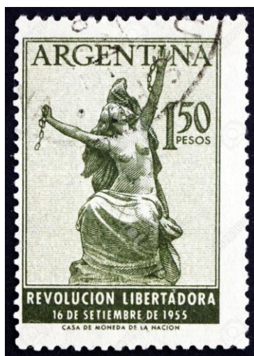
Fig. 5: Sello postal que conmemora, de forma muy alegórica, la «Revolución Libertadora»

Debemos reconocer que dicha observación de Giménez Puig es, cuanto menos, interesante y que puede respaldar una hipotética manufacturación previa a los hechos. Quizás alentada por un exceso de confianza en el éxito del movimiento, el cual no se prolongaría más allá del día 16 de septiembre. Sin embargo, nos permitimos disentir de su postura. Entendemos que, si como efectivamente parece, la producción de estas medallas se hizo como una «cachetada propagandística» dirigida al Ejército, y especialmente al general Franklin Lucero, quien con sus dichos subestimó la capacidad de la Armada para llevar adelante un alzamiento con éxito contra Perón, su manufacturación debe obedecer a un hecho ya consumado; a una situación de euforia, en la cual, quienes ya habían asegurado su victoria, se despacharon con rabia y jactancia, demostrando las «cinco guitas» que valía la Armada. Asimismo, existen varias medallas oficiales, algunas muy posteriores, que conmemoran la «Revolución Libertadora», como también sellos postales (ver Fig. 5). En ellas, la fecha icónica que se menciona es justamente 16 de septiembre, lo que demuestra que esa fue, en definitiva, la fecha pétrea que pasaría a la historia, el punto de inflexión; en definitiva, la fecha oficial.