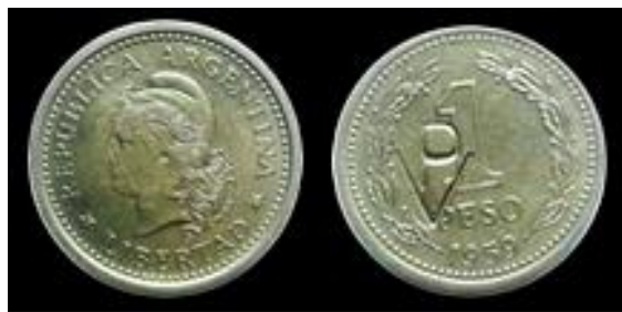
Fig. 13: 1 peso 1959. Acero enchapado Contramarca «PV» («Perón Vuelve») en reverso CJ: #254