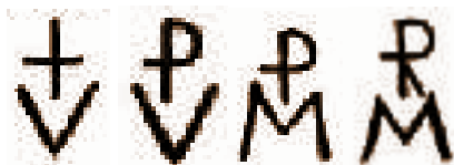
Fig. 10: Evolución del signo «Cristo Vence».

Es curioso notar el ingenio popular a la hora de transformar y resignificar la simbología de sus enemigos políticos. El «PV» (véase la Fig. 8), es una evolución del mismísimo «Cristo Vence» (conformado por una cruz sobre una enorme letra «V»), de tradición católica, que era uno de los eslóganes esgrimidos por los sectores antiperonistas, en razón a las insalvables disputas que surgieron entre Perón y la Iglesia Católica. El símbolo de «Cristo Vence» (Fig. 9), se vio, por ejemplo, pintado en los fuselajes de los aviones de la Aviación Naval que bombardearon Plaza de Mayo en junio de 1955 con el objetivo de derrocar al gobierno peronista ( vide supra ) 45 . La evolución de la simbología, incluso fue más allá, y las modificaciones hechas por unos a las pintadas, obtenían nuevas modificaciones y resignificaciones de las mismas por parte de los contrarios. A continuación, se resumen estos cambios: