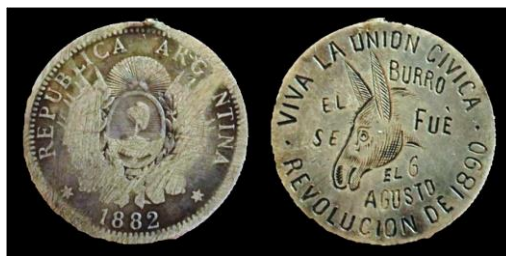
Fig. 6: 50 centavos («Medio Patacón»). 1882. Plata. Colección particular (Buenos Aires). Moneda host: CJ# 13

de carácter cívico-militar 34 liderada por la naciente Unión Cívica . Si bien la insurrección fue sofocada por las autoridades gubernamentales, los acontecimientos violentos provocaron la renuncia del presidente Miguel Juárez Celman. En aquella oportunidad, sectores insurrectos aplicaron modificaciones sobre el numerario circulante de la época y grabaron en las piezas consignas tales como «VIVA LA UNION CIVICA EL BURRO SE FUE» (véase Fig. 6). «Burro» era el apodo que el presidente se había ganado desde la prensa. Tras su renuncia, era usual que en las calles la gente cantara, al ritmo de «pan francés»: « Ya se fue, ya se fue/el burrito cordobés ».