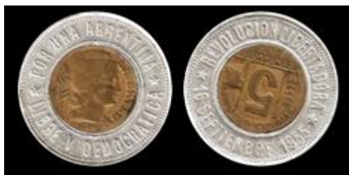
4 - Colección De Ansó (Buenos Aires) Fecha de la moneda del centro: 1946