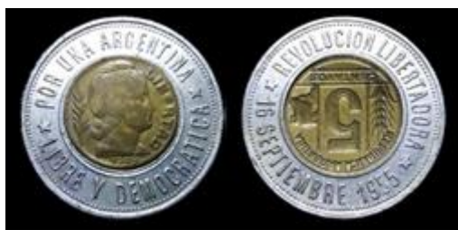
5 - Colección Landin (Caseros) Fecha de la moneda del centro: 1949