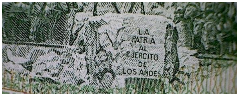
Fig. 16. Detalle del reverso del billete en dónde se puede ver «PV» en la palabra PATRIA.

La curiosidad de la que daremos cuenta recae en lo que parece ser una muy diminuta marca «PV» («Perón Vuelve») que puede apreciarse en el reverso (Fig. 16). Esto se puede hacer mediante el uso de una buena lente de aumento, centrando la vista en la inscripción LA PATRIA AL EJERCITO DE LOS ANDES, que es parte del histórico monumento «Cerro de la Gloria», ubicado en Mendoza. Para esta marca, daría la impresión que se hizo uso de la «P» que conforma la inscripción oficial del monumento, y justo bajo ella, pareciese que, en la plancha original del diseño, se hubiese grabado una «V», dotando de nuevo sentido a la leyenda.