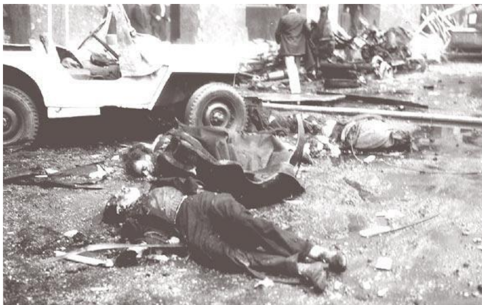
Fig. 1: Estragos causados por el bombardeo a la Plaza de Mayo sobre la población civil (perpetrado por la aviación naval el 16 de junio de 1955).

eran frecuentes los panfletos dirigidos a la población civil. 10 Estos escritos ayudaron a preparar el «clima» para la «Revolución Libertadora».