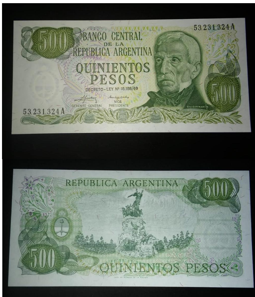
Fig. 15: 500 pesos. 1975. Color verde claro. Firmas: Mondelli-Zalduendo Medidas reales: 75 x 155 mm. Colección particular (Buenos Aires).

Presentamos, entonces, una imagen (Fig. 15) y descripción del billete en cuestión: