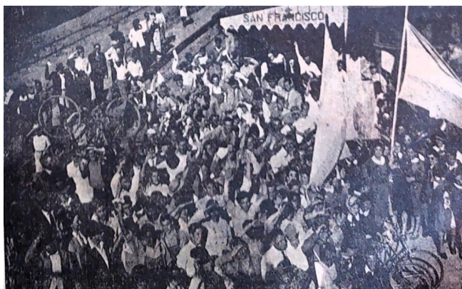
Un grupo de manifestantes congregados en la estación de FF.CC. del Estado durante las manifestaciones realizadas en esta ciudad durante la tarde de ayer.

El 17 de octubre de 1945 se vivió en la ciudad de una forma muy intensa porque fue masiva la decisión de los trabajadores de defender los beneficios que habían obtenido de Perón lo que significaba, sin ninguna duda, defender la figura de este líder. Era una angustia generalizada saber que Perón se encontraba detenido en la isla Martín García y por eso todos decidieron salir a la calle con la finalidad de lograr su liberación [...] Sin exagerar, el 90 por ciento de los trabajadores adherían al peronismo. El caso es que el 18 de octubre, tras conocer los hechos acontecidos en Buenos Aires, decidimos no mantenernos al margen de los acontecimientos que marcaron esa fecha. Casi naturalmente, sin haberlo organizado anteriormente, los dirigentes de los distintos sindicatos, coincidimos realizar una concentración para expresar nuestro afecto a Perón (LVSJ, 17/10/1995).