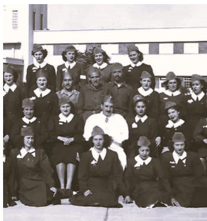
Obreras de la fábrica militar, años 1940

Otro hecho importante, fue la creación, en 1942, de la Fábrica Militar San Francisco, destinada a la producción de insumos básicos. Esta fábrica tuvo la particularidad de emplear a un gran número de mujeres para la costura de municiones.