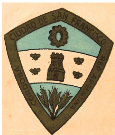
Escudo de San Francisco creado en 1936. Ordenanza n°526, 1936

jo productivo. Así, la rueda dentada de la industria, las abejas que simbolizan la laboriosidad de la colmena humana, y las espigas, que representan la actividad agrícola vigente, manifiestan una localidad pujante y en continuo progreso. 6